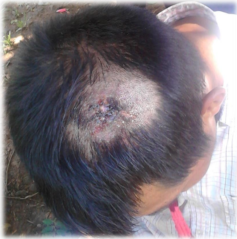
Este hombre presentaba golpes en su cráneo. Sí pudo conversar con los observadores, pero se quejaba de fuertes dolores de cabeza.