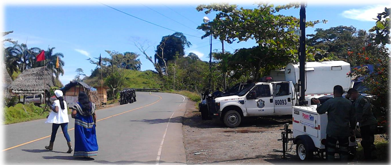
Entrada del equipo de observación a la Comunidad de Gualaquita. Sobre la vía Chiriquí Grande – Changuinola, Sábado 27 de agosto de 2016.