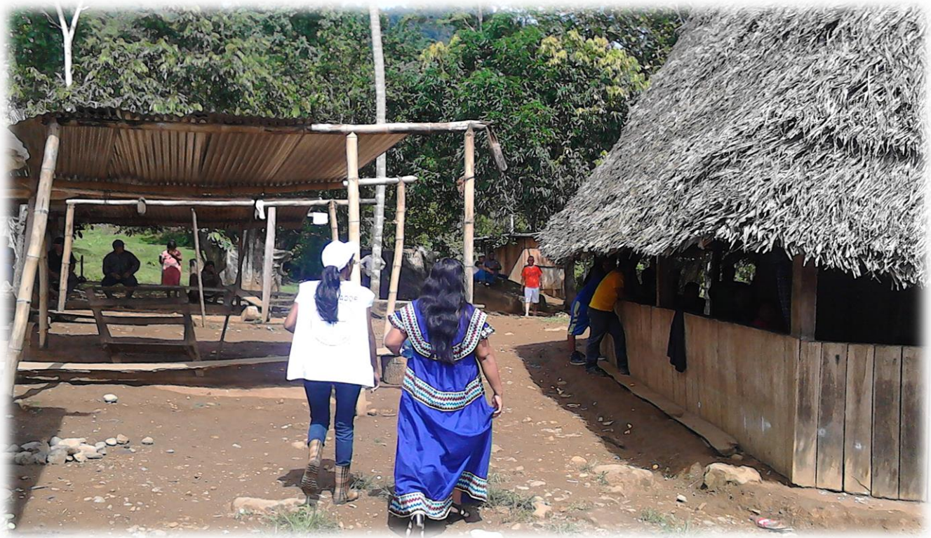
Observación de las casas de Gualaquita.