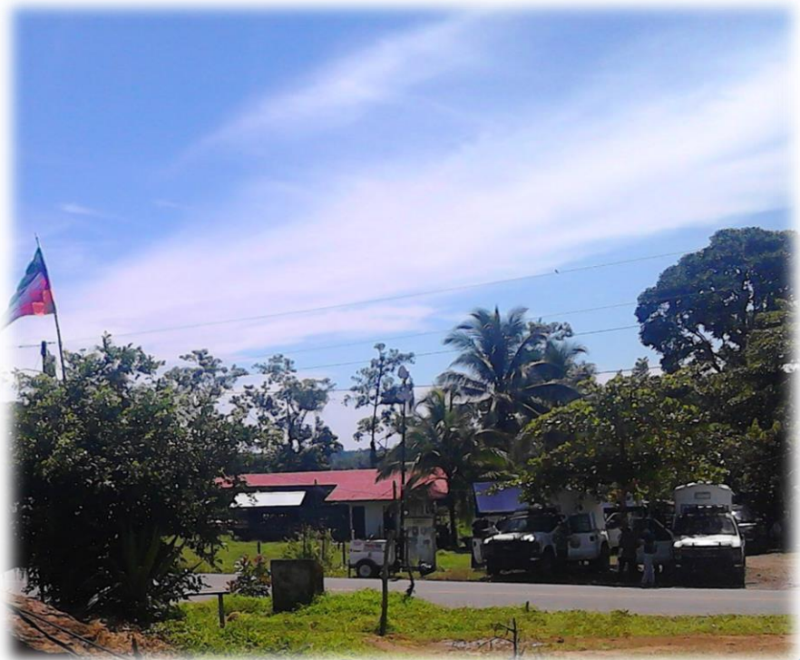
Vista panorámica de las Unidades de Control de Multitudes apostadas a la orilla de la carretera. Así se observaba desde lo alto del caserío de Gualaquita.