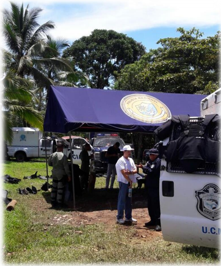
Miembro del equipo de Justicia y Paz, conversando con oficiales de la Unidad de Control de Multitudes (UCM), de la Policía Nacional frente a la comunidad de Gualaquita.