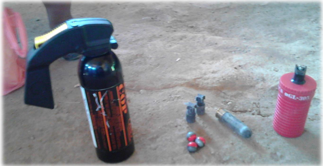
Objetos mostrados por líderes de la comunidad, según su testimonio, utilizados por la Policía contra los manifestantes.