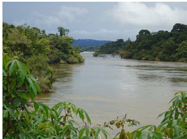
तपाजोस महानदी, जो कि एमेज़ॉन की उपनदी है, पर कई सारे बाँध बनाने की योजना चल रही है। ये बाँध राष्ट्रीय पार्कों, रिज़र्वों व मूल ज़मीनों पर जल भराव कर देंगे।

सी डी एम के विचाराधीन प्रोजेक्टों के विषय में नवीनतम जानकारी छड़ें द्वातच्छ'स एन्टरनेट की ई मेल सूची व 'इन्टरनेशनल रिवर्स' सी डी एम तहायड्रो लिस्ट ( katy@internationalrivers.org ) से जल्द सम्पर्क किया जा सकेगा) से प्राप्त करें।