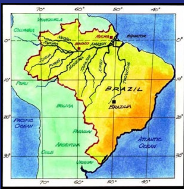
एमेज़ॉन की नदियों का मानचित्र