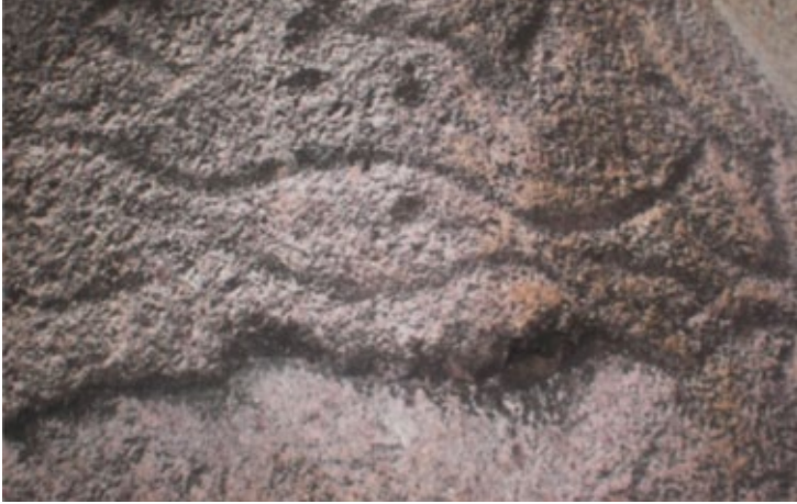
कोलम्बिया पूर्व की एक पत्थर का स्थल जो ई आई ए में सूचिग्रस्त नहीं है व जिसे वारो ब्लांको प्रोजेक्ट से वाद गस्त होने का खतरा है। निर्देशांक 8 | 24804481 | 615833 कोमारका नगावे वूगले

259 हेक्टेयर के वारो ब्लांको बॉथ का जलाशय तवासारा नदी के तटों को रूके हुए पानी से भर देगा जिसके कारण यहाँ मौजूद कोलम्बिया पूर्व की सभ्यता के जादुई चिन्हों के अवशेष जैसे कि प्राचीन शिलालेख हमेशा के लिए डूब जाएंगे। नदी के तटों पर रमणीक 50 हेक्टेयर के जंगलों के कटने और कम्पनी के द्वारा पुनरोपण के लिए तय की गई जमीन पर भी दुःप्रभाव देखने को मिलेगा। कम्पनी यहाँ पर गैर मूल की प्रजातियों, जो कि व्यावसायिक ज़्यादा हैं, जैसे कि सागौन व चीड़ के पेड़ों को लगाएगी। दुर्भाग्य से इस ट्रोपिकल वन के कटने से यहाँ की उभयचारी प्रजातियों के भी विलुप्त होने का खतरा हो जाता है जैसे की तवासारा रेन फॉग। ई आई ए में इस बात का कोई भी जिक्र नहीं है। तवासारा नदी के तट पर मेरी पिछली यात्रा के दौरान, साइकेड का मधुर संगीत वातावरण में गूँज रहा था व उसके विशालकाय पत्थरों से टकराते हुए जल की शान्त व संगीतमय धुन मुझे अभी तक याद है। जीवन की यह धुन अब इसके बाद शान्त हो जाएगी और कभी सुनने को नहीं मिलेगी। इस प्रोजेक्ट के बनने के साथ ही जीवन की अन्तिम आवाज़ भी बन्द हो जाएगी।