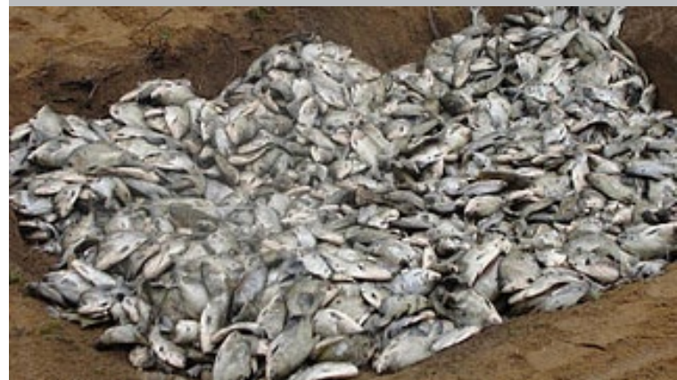
भेडेरिया नदी की जैव विविधता सेन्टो एन्टोनियो बाँध से खतरों में है - निर्माण कार्यों के दौरान ही करीब 11 टन मछलियों की मृत्यु हो गई थी।