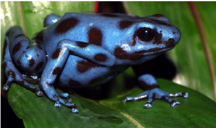
The Tabasara River